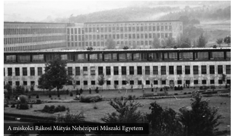
A miskolci Rákosi Mátyás Nehézipari Műszaki Egyetem

Amellett, hogy lelkileg is megviselte a művészt a tudat, hogy családja is börtönbe került, és róluk sokáig semmit sem tudhatott, nehezen dolgozta fel azt is, hogy két és fél éven át nem gyakorolhatott zongorán. A megbélyegzés és ez a tény a zongoraművészi pálya álmának végleges megghiúsulását vetette fel, ráadásul, túl a lelki terheken, a fizikai igénybevétel a munkatáborban maradandó sérüléseket okozott a kézizületeiben. Sokáig terjedt az a legenda, hogy Recsken Cziffra ujjait tudatosan